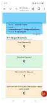
WhatsApp Image 2025-03-19 at 18.26.09_48caac02.jpg 163K