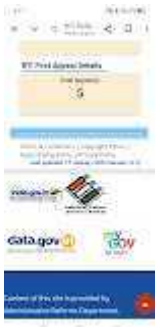
WhatsApp Image 2025-03-19 at 18.26.10_0035a2dc.jpg 58K